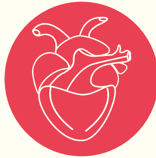
اضطرابات في القلب مثل: أمراض القلب الخلقية