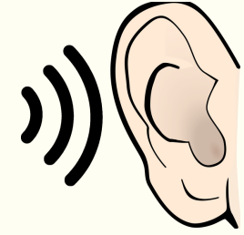
مشاكل في السمع